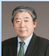
一般社団法人 流通問題研究協会 副会長 ホビーッキングフェア実行委員会 委員長

感染症対策があり、過去のように13万人もの来場者をお迎えできないかもしれませんが、でも体験会話はできます。今年のホビーッキングフェアのテーマは、“食卓を元気にする、手づくりっていいね!”です。それぞれのブースで“一緒に考える、一緒にやる”を活かしてください。一般社団法人流通問題研究協会(IDR)では、ご出展の方々と声の交換をやる場をつくりたい、と思います。